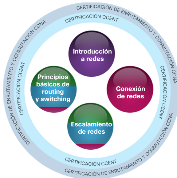
Figura 1. Cursos de CCNA Routing and Switching

El currículo de CCNA Routing y Switching consta de cuatro cursos que conforman la ruta de aprendizaje recomendada. Los estudiantes recibirán preparación para el examen de certificación Cisco CCENT® luego de completar una serie de dos cursos, y para el examen de certificación de CCNA Routing y Switching, luego de completar una serie de cuatro cursos. El currículo sirve además para que los alumnos desarrollen habilidades que los preparen para el mundo laboral y sienta las bases para el éxito en carreras y programas de grado relacionados con las redes. En la figura 1, se muestran los distintos cursos que se incluyen en el currículo de CCNA Routing y Switching.