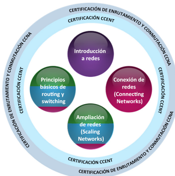
Figura 1. Cursos de CCNA Routing and Switching

El currículo de CCNA Routing y Switching consta de cuatro cursos para conformar la ruta de aprendizaje recomendada. Los estudiantes recibirán preparación para el examen de certificación Cisco CCENT® luego de completar una serie de dos cursos, y para el examen de certificación de CCNA Routing y Switching, luego de completar una serie de cuatro cursos. El currículo sirve además para que los alumnos desarrollen habilidades que los preparen para el mundo laboral y sienta las bases para el éxito en carreras y programas de grado relacionados con las redes. En la figura 1, se muestran los distintos cursos que se incluyen en el currículo de CCNA Routing y Switching.